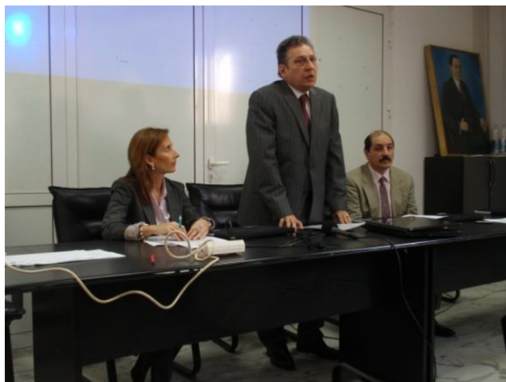
Снимки от събитието: